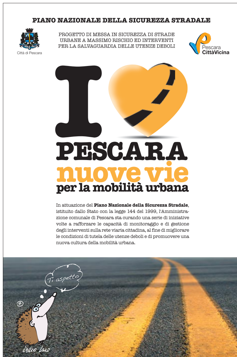
cartolina 10x15 - fronte